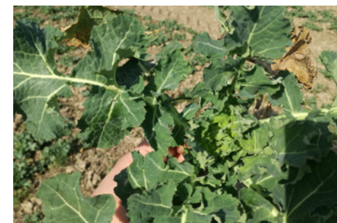
nisko osadzony stożek wzrostu zapewnia dobre zimowanie

Wyjątkowy potencjał plonowania odmiana potwierdza w badaniach COBORU, a także na polach u naszych klientów. Od jesieni 2016 prowadzimy obserwacje na plantacjach z Panamą w całej Polsce. Sprawdź, jak Panama przetrwała zimę i jak rozwija się w bieżącym sezonie na stronie: www.panama.agrii.pl